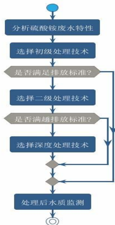
图3-1硫酸铵废水处理技术流程图

综上所述，硫酸铵废水的处理策略需以科学的实验为基础，结合详实的数据分析和不断的技术迭代。研究应当聚焦于废水处理过程的可操作性、经济性以及环保效益，同时确保技术方案具备良好的泛化能力和稳定性，从而在理论层面和实践层面均有所突破和贡献。通过对处理技术全面的评估和优化，能够更好地适应环境保护法规的要求，推动废水资源化和减少生态足迹。