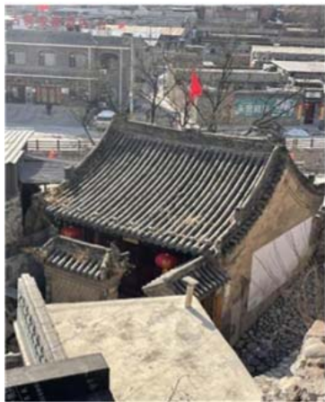
图4 大梁江村瓦房类型图

瓦房大多为经济较好的居民所用。大梁村古属山西, 主要采用山西瓦房的形式, 其结构核心为四梁八柱, 石基以条石为主, 外墙则就地取材, 选用青砖砌成, 内部墙体则施以灰泥装饰, 展现质朴之美 [6] 。屋顶设计以抬梁式为骨架, 辅以椽子支撑, 外覆苇箔与灰泥, 再以灰瓦铺设, 形成典型的硬山式起脊屋顶, 多数为单向坡设计, 外墙较高, 寓意“肥水不流外人田”, 如图4所示。