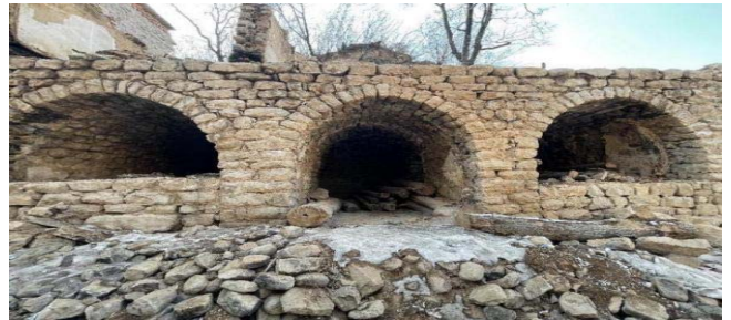
图2 大梁江村窑洞类型图(作者自摄)

窑洞类型由于太行山特殊的地形条件,大梁山的民居大多采用沿山而建的窑洞,与陕北窑洞直掏式施工方法不同,太行山民居主要依赖山墙崖壁建筑,以一米左右厚度的墙体抵御侧推力,这一“穴,居式”民居最大的特点就是冬暖夏凉,门洞处拱拱加上高窗,冬天可以使阳光进一步深入到窑洞的内侧,从而充分利用太阳辐射,而内部空间也因为拱形的,加大内部竖向空间,使人们感觉开敞舒适,如图2所示。