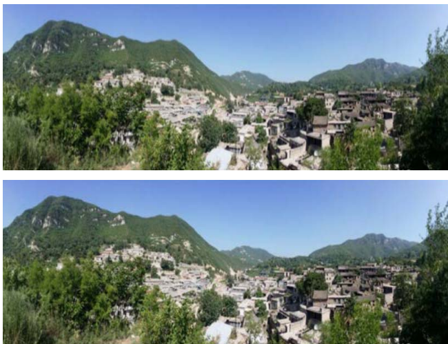
图1 大梁江村鸟瞰图

大梁江村成村年代较早,因社会动荡且山内野兽较多,故大梁江村背靠山脉,自下而上拾级而修,仅保留村阁为通往村落内部的唯一通道,村内高差大,在村内可直接观察到村口,形成游离的防御体系,满足村民心理上和实际的安全。