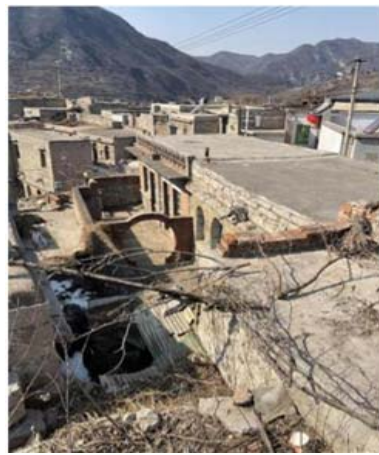
图3 大梁江村石砌平顶房类型图

平顶房的建造形式简单,多为小户人家采用,不仅在建筑建造上有着便宜性和坚固性的特点,同时建筑材料还具有良好的隔热性。厚重石块为基础墙体,用白石灰粘合,屋顶则采用薄而宽的石板,如图3所示。平顶房的屋顶可用作粮食晾晒,有一定的坡度,设有专门的排水,可将雨水收集汇聚到地窖,经过处理后用来洗衣等。